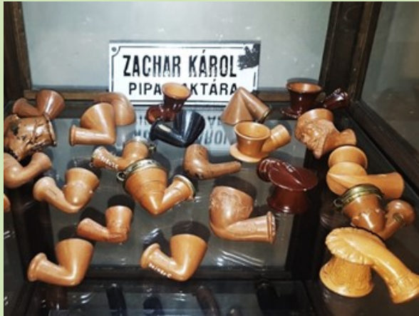
Het AIP congres in het Nationaal Museum in Budapest (15)