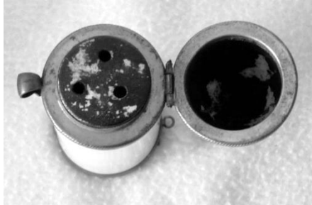
Afb. 4a-b. Scharnierpunt, ketelbodem met drie gaten en ingebrande residu in vochtkamer.