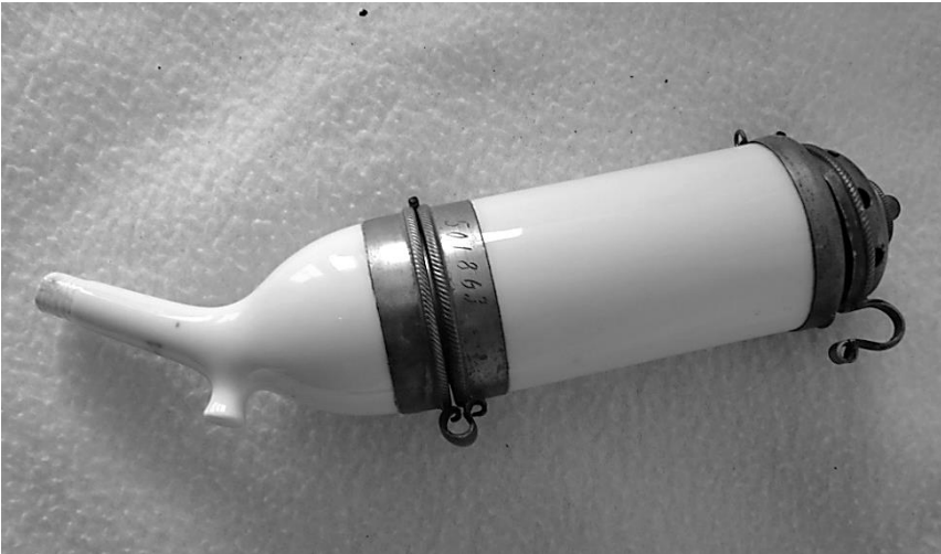
Afb. 1. Complete kop, hoogte 16 cm.

Onlangs vond ik op een overvolle kraam van een vlooiemarkt een merkwaardige porseleinen pijpenkop. De witporseleinen pijpenkop bestaat uit twee scharnierende delen. Voor een luttel bedrag werd ik eigenaar van de pijpenkop, plus koord en een slordig gelijmd vochtreservoir. Volgens de koopman hoorden deze onderdelen bij de totale pijp; de steel was hij echter kwijt geraakt. Omdat nog nooit eerder zo een merkwaardige pijpenkop zag, lijkt het me zinvol dit met de lezers te delen. Mogelijk kan iemand aanvullende informatie geven.