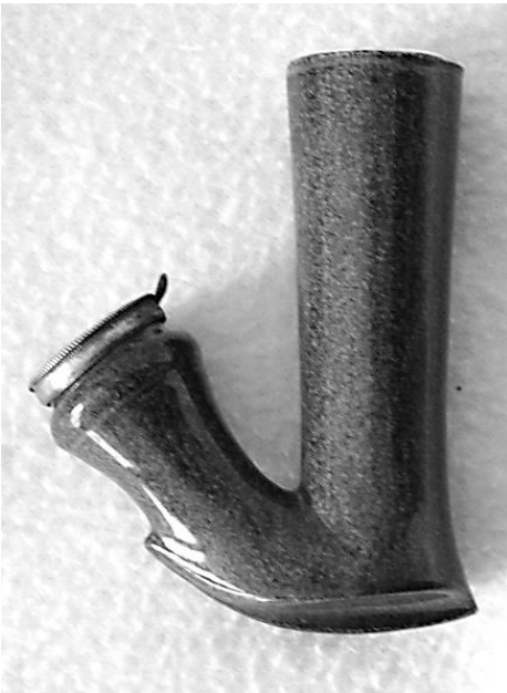
Afb. 5. Pijpenkop van granietgrijs-kleurig porselein met vaste vochtkamer, 1825-1850. Messing montuur, hoogte 90 mm.