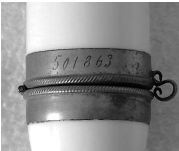
Ab. 2. Inscriptie 501863.