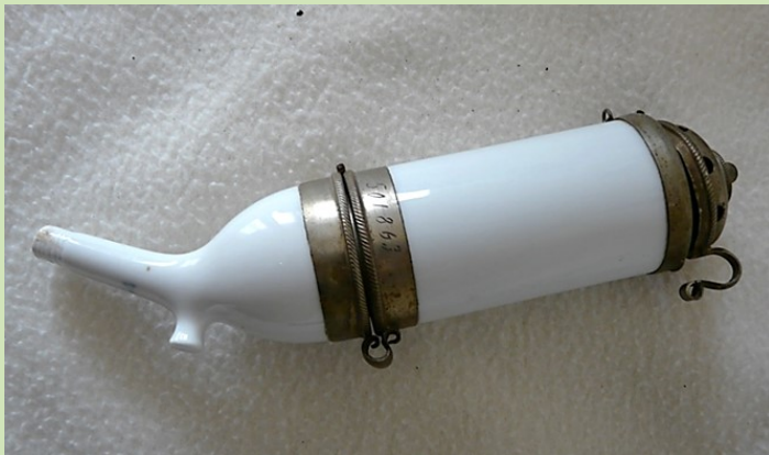
Tweedelige porseleinen pijpenkop (pag.18)