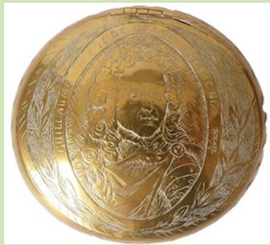
Tabaksdoos met op de voorzijde het portret van Willem III (pag. 11)